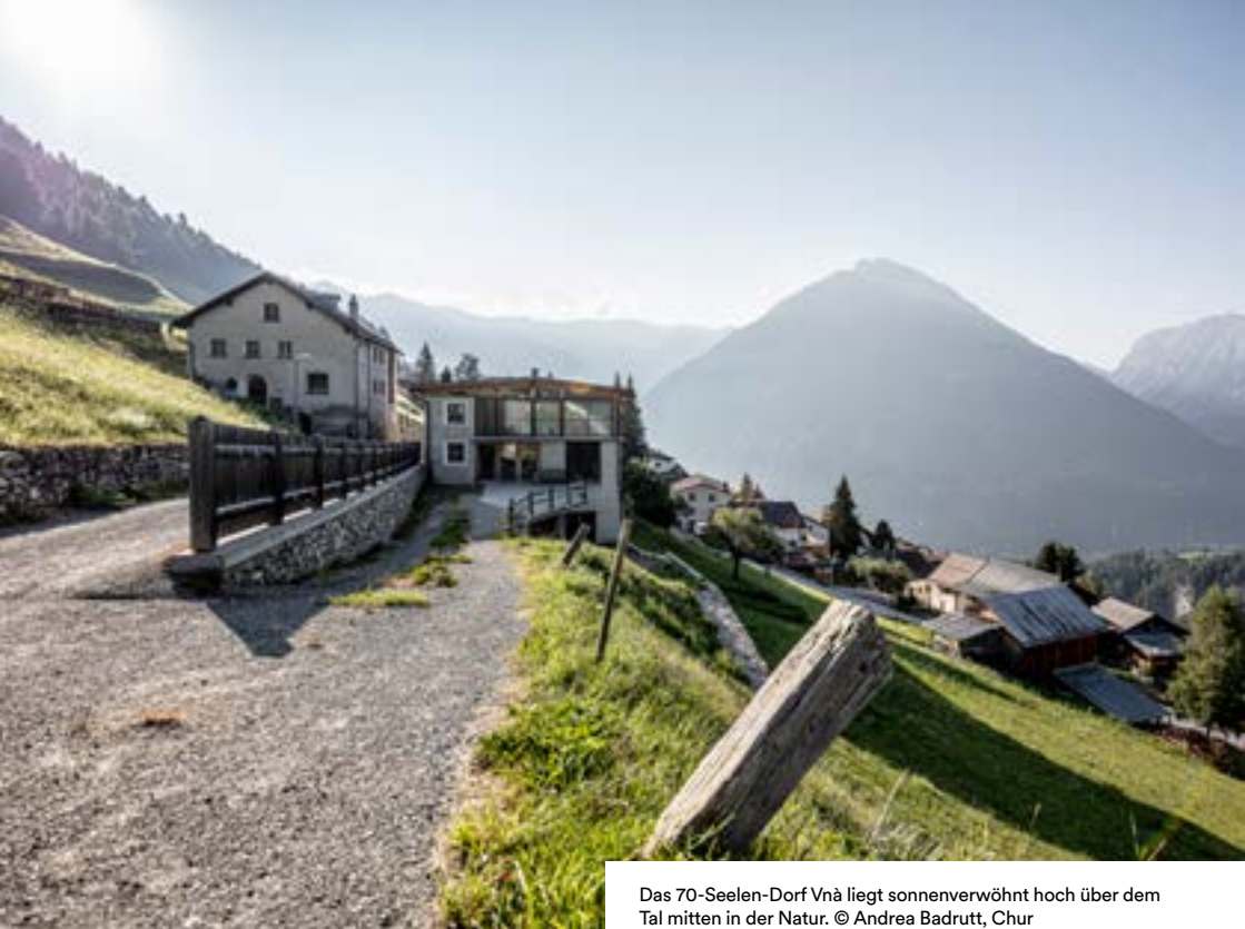
Das 70-Seelen-Dorf Vnà liegt sonnenverwöhnt hoch über dem Tal mitten in der Natur.