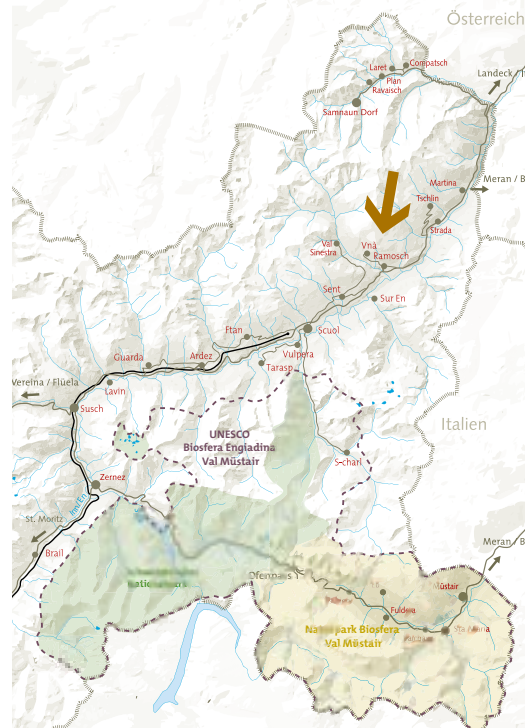
Einen detaillierten Ortsplan von Ramosch/Vnà finden Sie in der Heftmitte.

1 h 50 min: St. Moritz – Skigebiete Oberengadin, UNESCO Weltkulturerbe Rhätische Bahn Albula/Bernina