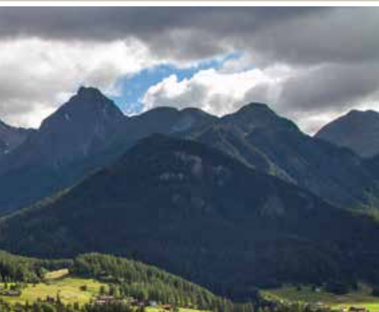
Blick von Ftan auf Tarasp

notabene, gelangt man schliesslich nach Tarasp Fontana. Von Fontana kann man entweder weiter taleinwärts oder erst mal hoch Richtung Schloss und Sparsels gehen. Fast so bekannt wie das Schloss ist das Schlosshotel oder das Chastè, wie es im romanischen Idiom heisst. Seit 22 Generationen führt das Haus mit der exzellenten Küche die Familie Pazeller. Tatsächlich ist die Geschichte eng mit der des Schlosses verknüpft. Als der Mundwasserfabrikant Lingner das Schloss kaufte und umbauen liess, richteten die geschäftstüchtigen Pazellers auf ihrem Hof Gästezimmer für die Arbeiter ein. Bald gaben sie den Hof ganz auf und setzten voll auf Gastronomie und Hotellerie.