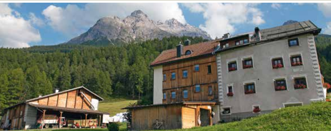
Stall und Engadinerhaus in Fontana vor dem Pisoc-Massiv