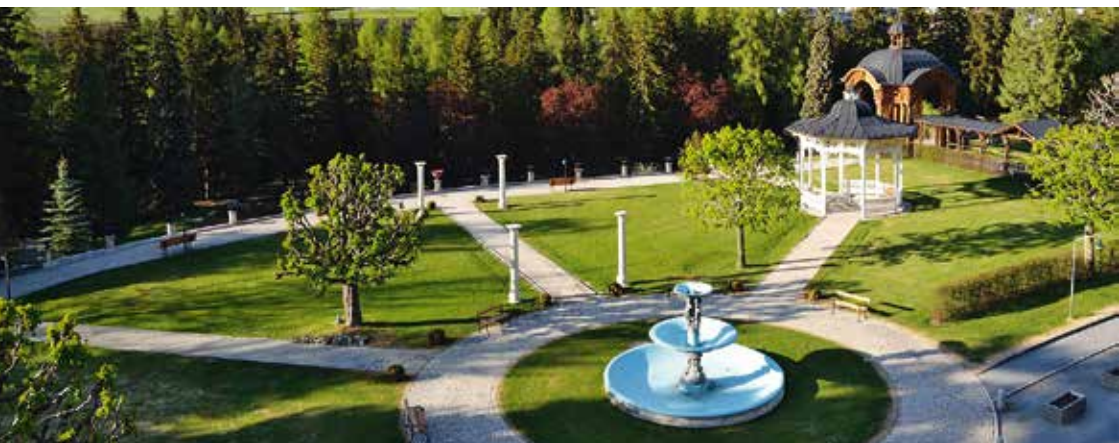
Der Kurpark in Vulpera zeugt von der einstigen Bäder- und Kurepoche.