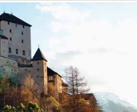
Das Schloss Tarasp, im Hintergrund der Piz Plavna Dadora und der Piz Plattas

mit der Stiftung Chastè da Tarasp und der Gemeinde wurde der Eigentumswechsel im März 2016 besiegelt und das Schloss ist wieder in Schweizer Händen. Der neue Besitzer, der weltbekannte Künstler Not Vital aus Sent, wird eine neue Ära in der über 1000-jährigen Geschichte des Schlosses einläuten. Mittels zeitgenössischer Kunst und einem Skulpturenpark möchte Not Vital das Schloss zu einer Kulturattraktion von nationaler und internationaler Bedeutung weiterentwickeln. Das Schloss Tarasp soll weiterhin öffentlich zugänglich bleiben.