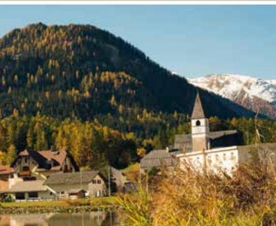
Fontana am Lai da Tarasp, im Hintergrund der Piz Nair

Kurhotels – Kurhaus Tarasp (heute Scuol Palace), Hotel Schweizerhof und das im Jahre 1989 leider niedergebrannte Hotel Waldhaus in Vulpera – wurden in der Zeit zwischen 1875 und 1910 erbaut. Seit den 1960er-Jahren hat die moderne Medizin und Pharmakologie das Interesse an den Kuren kontinuierlich reduziert. Der Bädertourismus war nicht mehr gefragt. Die grossen Hotels richteten sich auf Sport- und Freizeitaktivitäten aus und sprachen damit andere Gästegruppen an. Im Jahre 1955 wurde in Scuol die erste Seilbahn auf die Motta Naluns gebaut, womit ein neuer touristischer Aufschwung eingeleitet wurde. Die Anlagen sind aus der Region nicht mehr wegzudenken. Sie erschliessen dem Gast ein wunderschönes Wander- und Skigebiet und bieten vielen Einheimischen Arbeitsplätze.