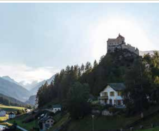
Der Lai da Tarasp und das fast 1000-jährige Schloss prägen Ortsbild und Landschaft von Tarasp.

man das heute vielleicht nennen. Das waren die ersten bewirtschafteten Ferienwohnungen der Schweiz. Wieder eine touristische Erfindung, die Tarasp vorweggenommen hat. Der Investor hat nicht nur Wohnungen gebaut, sondern auch die Tennishalle, er hat den Golfplatz erweitert, das Hallenbad im Hotel Schweizerhof eingebaut und die medizinischen Zentren in den Neubauten.